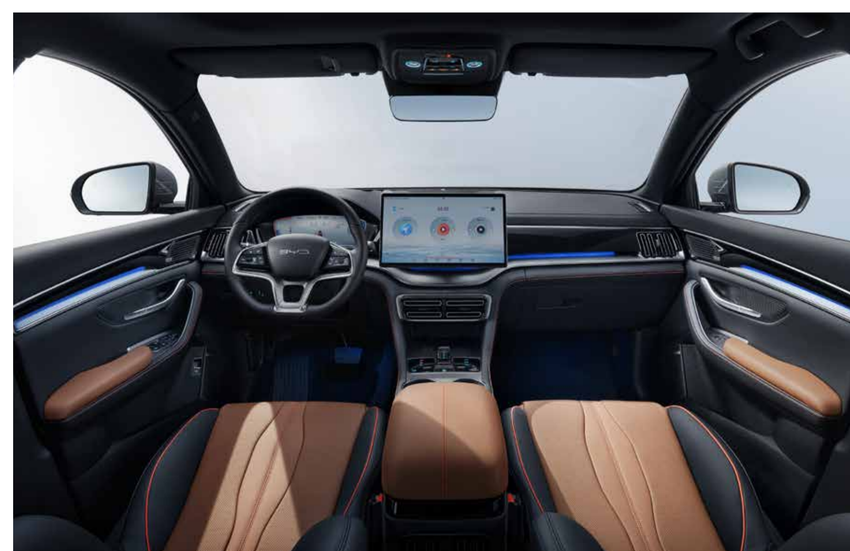
Black and brown